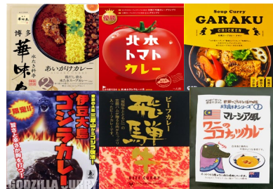
日本・世界のレトルトカレー