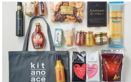
キタノセクション

北野エースが国内外のメーカーとのタイアップによって開発・製造・販売をしているプライベートブランド「キタノセクション」の商品も多数取り扱います。ドレッシングやジャム、菓子、ご飯のおともまで、多種多様な品揃えです。