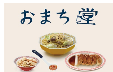
食雑貨も取り扱い