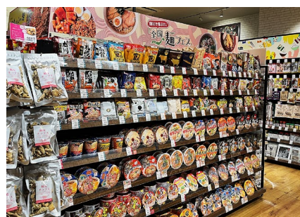
麺好き集まれ！全国麺フェス