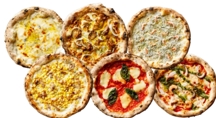
冷凍ピザよりどり販売 税込2,268円