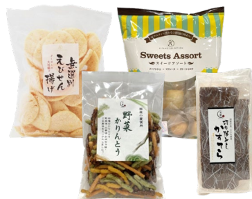
キタノセクション お菓子Happy Bag 税込1,080円

グランドオープン記念として、お菓子やレトルトカレーのHappy Bagのほか、大山ハムのHappy Bag、冷凍ピザ「PIZZAREVO」3点よりどり販売など、お得な販売企画をご用意しています。旅行雑誌「るるぶ」シリーズのパッケージを模したハチ食品のレトルトカレーは、書店でおなじみのビジュアルにご当地の味が詰まったレトルトカレーが5点セットに。数量限定商品は、無くなり次第順次終了となります。