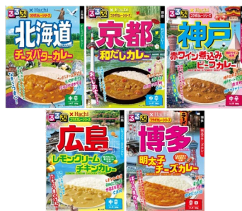
るるぶ×ハチ食品 レトルトカレーセット 税込1,080円