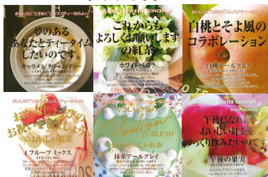
ギフトにもおすすめ ムレスナティー