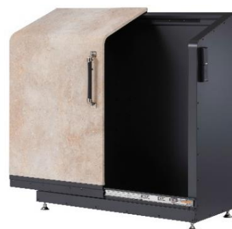
「インテリジェント ダスポン」

当社が開発した「ダスポン」は、オールステンレスボディによる耐久性・堅牢性とスタイリッシュなデザイン性の高さを兼ね備えた、次世代型ごみ集積庫です。