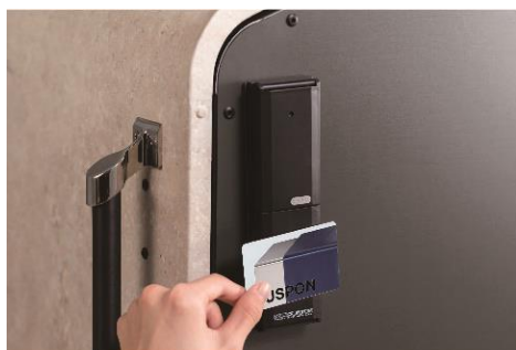
「インテリジェント ダスポン」施錠イメージ