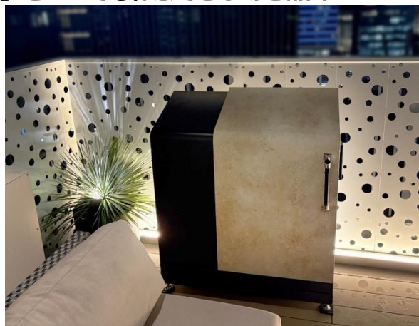
都内のショールームに設置している『ダスポン』

当社は、このたび東京都心部に『ダスポン』シリーズのショールームをオープンしました。『ダスポン』は、マンションや集合住宅向けに設計された“横スライド式”のごみ集積庫で、2018 年にはグッドデザイン賞を受賞するなど、機能性と美しさを兼ね備えた製品として注目を集めています。