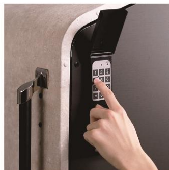
『インテリジェントダスポン ハイスリム』施錠イメージ