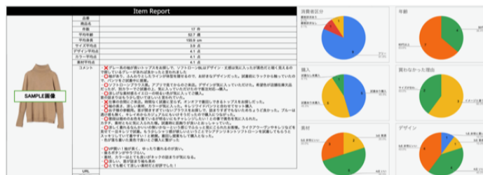
▲接客アプリからの取得データイメージ

今後も当社は、さまざまなデジタル施策を通じてリアル商業空間の新たな価値創造を支援してまいります。