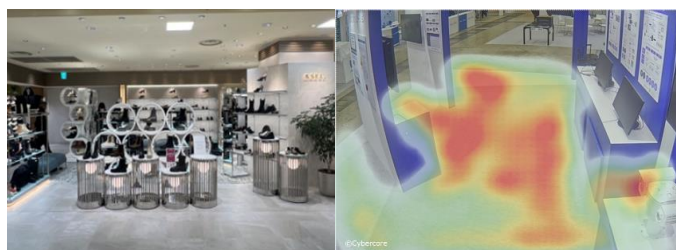
▲店内への AI カメラ設置