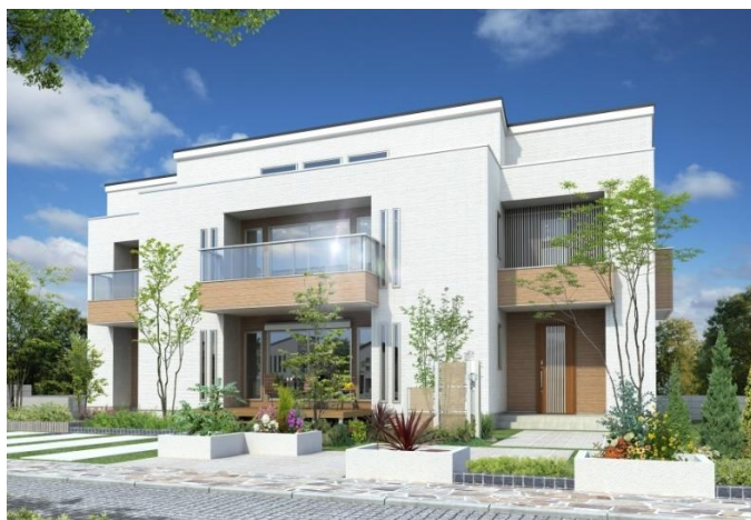
ZEH 水準省エネ住宅「QUAD」の外観イメージ

表彰対象の建物は、断熱性能の UA 値が 0.6 以下(断熱等性能等級 5)、省エネ性能の BEI 値は 0.8 以下(一次エネルギー消費量等級 6)で、ZEH 水準省エネ住宅の性能値を満たしており、住宅ローン(フラット 35)の金利優遇や住宅ローン減税の優遇措置、また国の補助金支援事業「子育てグリーン住宅支援事業」の対象となる省エネ基準も満たしています。