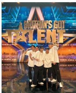
HARIBOW ダブルダッチ パフォーマンス