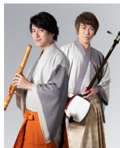
HIDE x HIDE 三味線 x 尺八