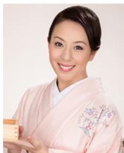
島田律子 タレント 日本酒スタイリスト