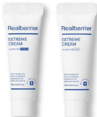
リアルバリア エクストリームクリーム [オリジナル] 10mL