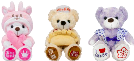
岩下の新生姜イワシカ (R)