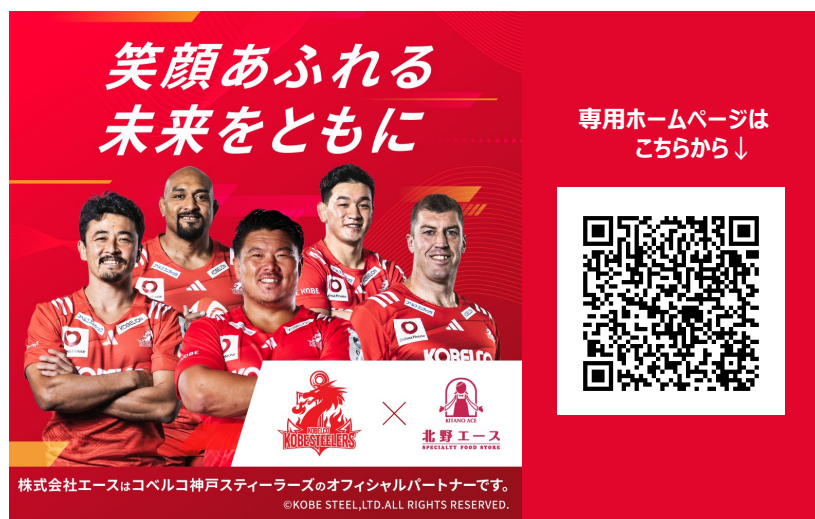
【キービジュアルイメージ】