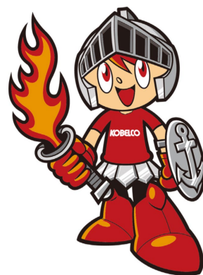
【チームマスコット コーロクン】