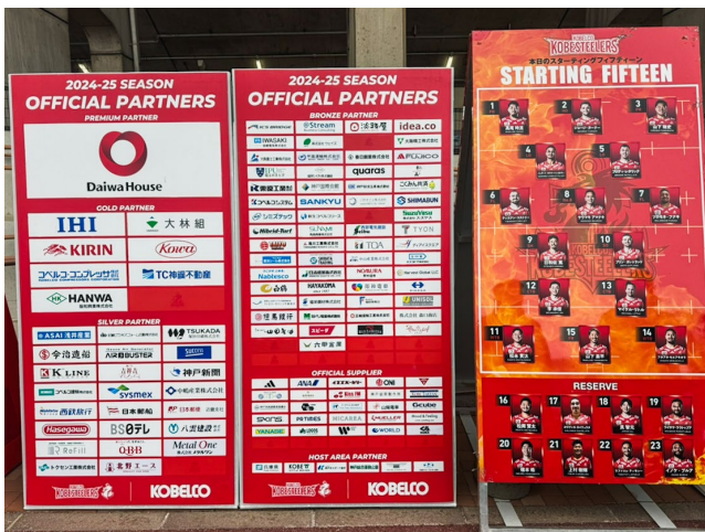
【ホストゲーム パートナーボード掲出イメージ】

私どもは1962年に兵庫県で創業し現在は食料品専門店「北野エース」を全国に展開しております。この度パートナーとして、神戸製鋼ラグビー部時代から数々の名勝負を繰り広げ、さらには震災も乗り越えて地元神戸のみならず全国のラグビーファンを魅了してきたコベルコ神戸スティーラーズを応援する機会をいただきました。神戸スティーラーズの戦士たちが未来の日本に勇気と希望を与えてくれる姿に期待しております。