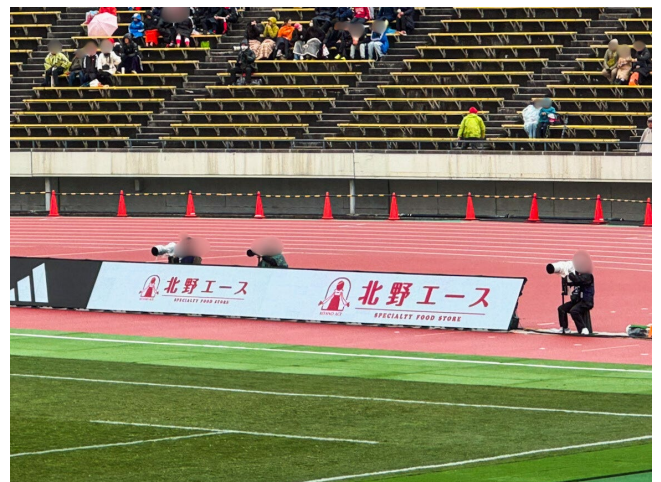
【ホストゲーム LEDボード掲出イメージ】