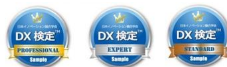
▲オープンバッジ画像サンプル

レベル認定された方には、ブロックチェーン技術を使ったスキルのデジタル証明・認証である「オープンバッジ」(2 年間有効)が付与されます。社内認定や、名刺等にも活用可能となります。