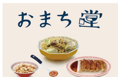
食雑貨も取り扱い