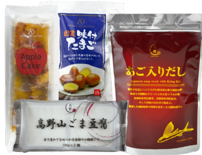
キタノセクション特別価格販売 商品一例