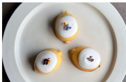
お取り寄せ商品例 Y's レモンケーキ