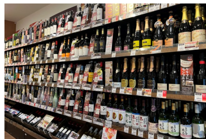
日本酒・ワインなど酒類