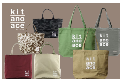
オリジナルエコバッグ