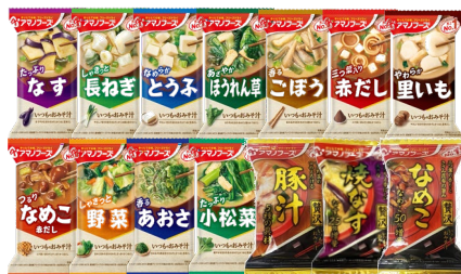
アマノフーズおみそ汁30個セット