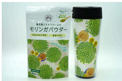
モリンガパウダー タンブラー

4月18日（金）より、リニューアルオープン記念企画を開催。鹿児島県てらすファームのモリンガパウダーを1袋ご購入のお客様に、オリジナルの専用タンブラーをプレゼント（先着30名様限定）。アマノフーズのフリーズドライおみそ汁30個セットやMCCスープよりどり販売などお得なセットをご用意するほか、高野山ごま豆腐やあご入りだしなどキタノセクション人気商品の特別価格販売も実施予定です。※数量限定商品は無くなり次第終了とさせていただきます。