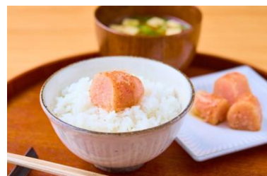
「めんたい重の昆布巻き明太子」調理イメージ