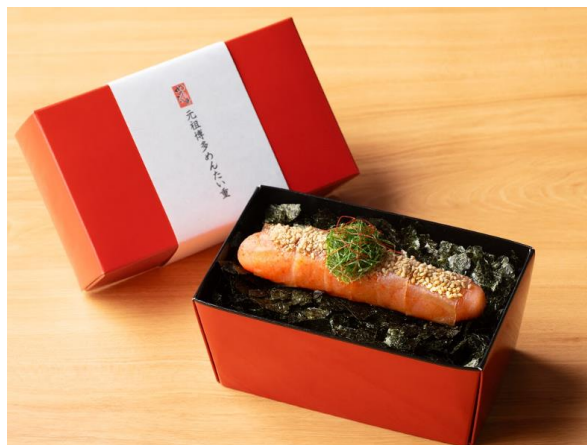
実演販売する「めんたい重」

元祖博多めんたい重株式会社が運営する、明太子料理専門店「元祖博多めんたい重（所在地:福岡市中央区）」は、2025年4月16日（水）より14日間限定で、新宿高島屋にて開催される催事「～新しい食の発信～春の美味コレクション 同時開催 むにぐるめ・ゆうとグルメ・はらぺこグルメ日記のグルメフェス!!」に初出店いたします。会期中は、関東エリアで唯一となる『めんたい重』の実演販売を実施。出来たての味わいをご提供するほか、人気のおみやげ商品も多数取り揃え、皆さまをお迎えいたします。