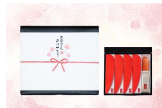
母の日専用の掛け紙