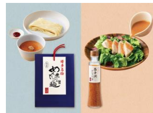
明太子料理専門店のこだわり詰め合わせ （調理例）