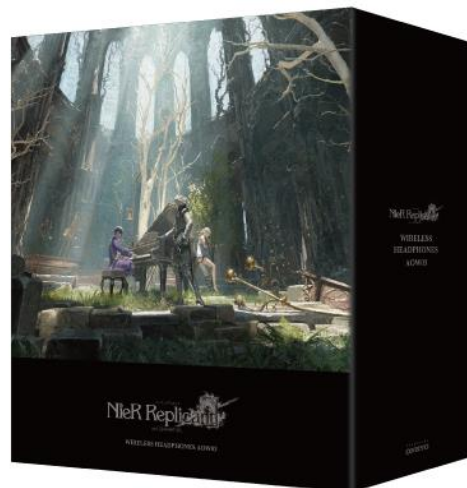
幸田和磨氏描き下ろしアート オリジナルパッケージ ※画像はイメージです