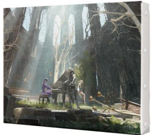
キャンバスアート