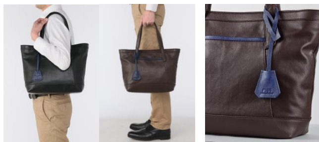
トートバッグ使用イメージ 左: 肩掛け(A-style 販売商品) 右: 手持ち(@SKY 販売商品)

この他にも、これからの季節に重宝するストレッチシャツやシャーリングパンツなどの商品を、A-style と @SKY でそれぞれ異なるカラー展開でコーディネートが楽しめます。ISETAN MEN'S と ANA のコラボレーションの証として、ダブルネームが入った、“ここでしか買えない”スペシャルコラボアイテムです。