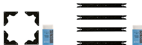
和映えお試しセット