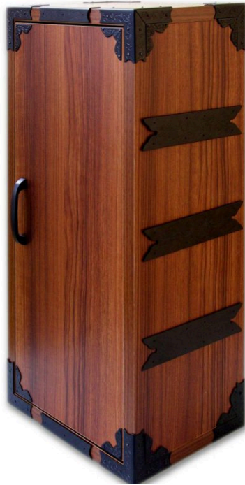
interzum(インターツム)2025出展 ワールド・プレミアムモデル

※現在、「和映え収納BOX」は一般向け開発準備中であり、本キャンペーン特典の対象商品ではありません。