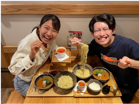
とびっきりの一枚、お待ちしております！（イメージ）

投稿内容は、お食事風景やおみやげ商品を使ったアレンジレシピなど、「元祖めんたい煮こみつけ麺」にまつわるものであればOK！ここでしか手に入らないオリジナルグッズもご用意しております。