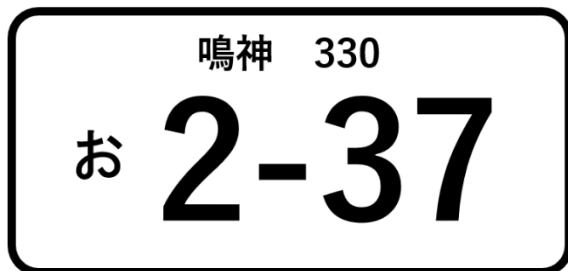
ナンバープレートに 7が一つの例