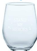
オリジナルビールグラス