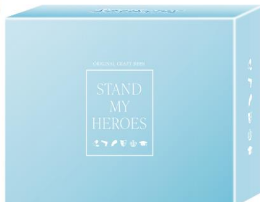
オリジナルパッケージ