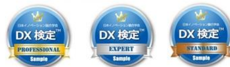
▲オープンバッジ画像サンプル

レベル認定された方には、ブロックチェーン技術を使ったスキルのデジタル証明・認証である「オープンバッジ」(2 年間有効)が付与されます。社内認定や、名刺等にも活用可能となります。