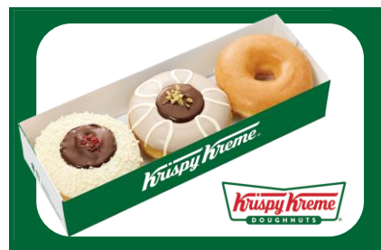
11/7(金)~11/11(火)限定 クリスピー・クリーム・ドーナツ