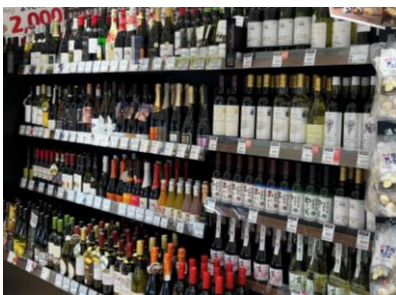
和種・洋酒コーナー

エキュート大宮店では全国の北野エースで唯一、店内併設の厨房で調理した惣菜を販売。埼玉県B級グルメ大会でグランプリを獲得した秩父名物「みそポテト」など地元食材を楽しめるラインアップに加えて、北野エースのプライベートブランド“キタノセクション”の八雲コロッケや店内で炊き上げたきのこご飯を使ったオリジナル弁当などの展開を予定しています。