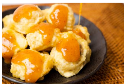
秩父名物「みそポテト」