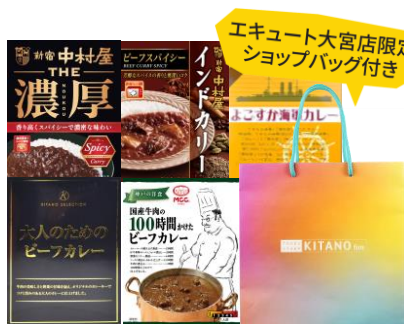
限定80セット レトルトカレーHappy BAG

リニューアルオープンを記念して、お得な商品の販売や試食販売などの企画を実施します。レトルトカレーHappy BAGや、クリスピー・クリーム・ドーナツ限定販売、地元埼玉県の水川ブリュワリーなどご当地メーカーによる試飲販売も実施いたします。