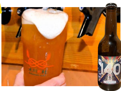
11/7(金)17:00~ 水川ブリュワリー試飲販売