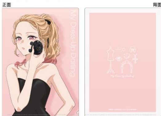
サイズ：310×220mm（A4サイズ対応） 素材：ポリプロピレン