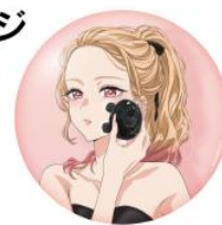
サイズ：φ56mm 素材：ブリキ