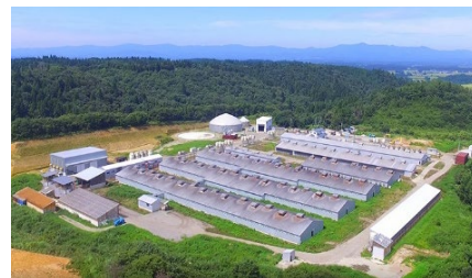
米の娘(こ)ファーム

事業内容 :豚・生産飼育業務、豚肉脱骨・整形及び部分肉製造業務、業務用食肉アウトパック業務、食肉・加工食品卸売業務、生鮮食品・米穀の販売、食肉加工品製造販売・飲食販売業バイオガス発電事業