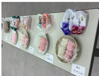
メーカー・等級別の紅白蒲鉾

幅広い品揃えをしているからこそ、商品知識の習得が大切と考えています。毎年の新入社員研修や中途社員研修でも、蒲鉾勉強会を実施。各地域の蒲鉾の特徴をバイヤーが講師となって説明しています。実際に試食し、味の特徴も学び、お客様が店舗でお買い物される際に、お買い物のお手伝いができるように努めています。