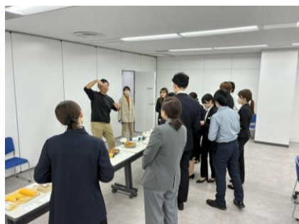
バイヤーによる講習