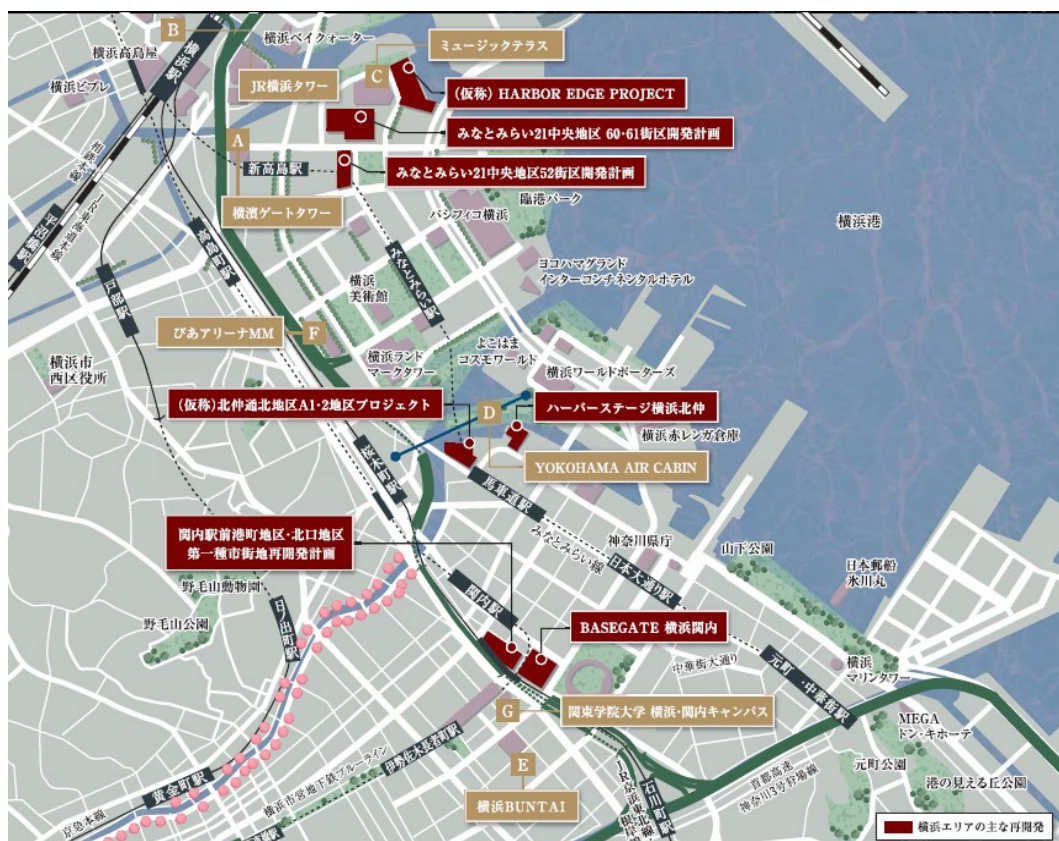
横浜エリア、近郊の再開発事業

不動産の人気を誇る街、横浜。横浜駅周辺では、将来にわたって再開発計画が進められており、今後さらなる地価の上昇が見込まれています。