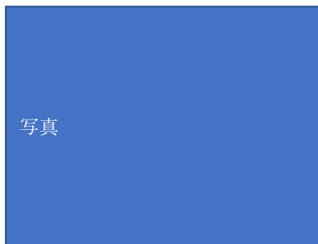
▲オリジナルルームウェア（イメージ）