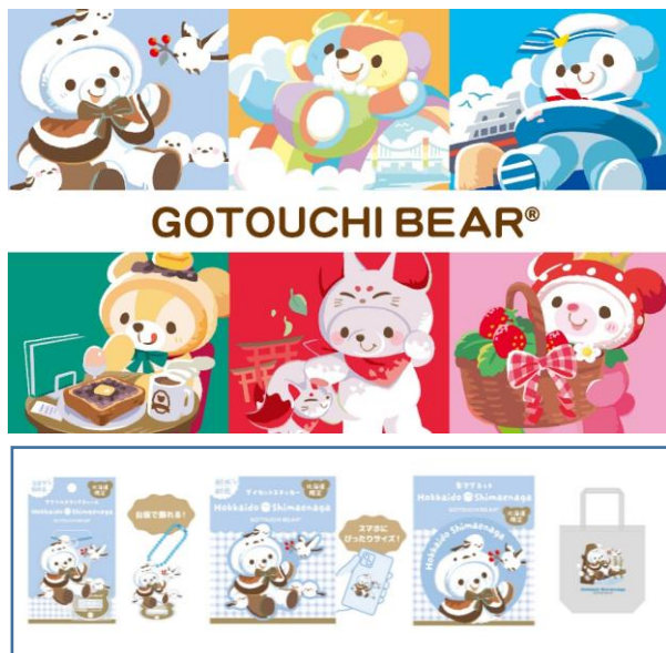
「ご当地ペア北海道シマエナガ」モチーフのアイテム