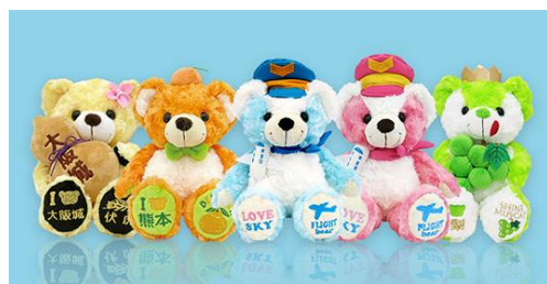
全国各地の観光地などで販売している FUJISEY の代表商品「ご当地ベア」

FUJISEYは、1970年の創業より半世紀以上にわたり、全国各地の様々なお土産を生み出してまいりました。