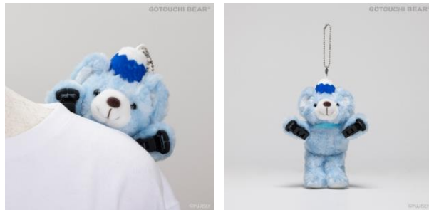
「ご当地ペアクリップマスコット」