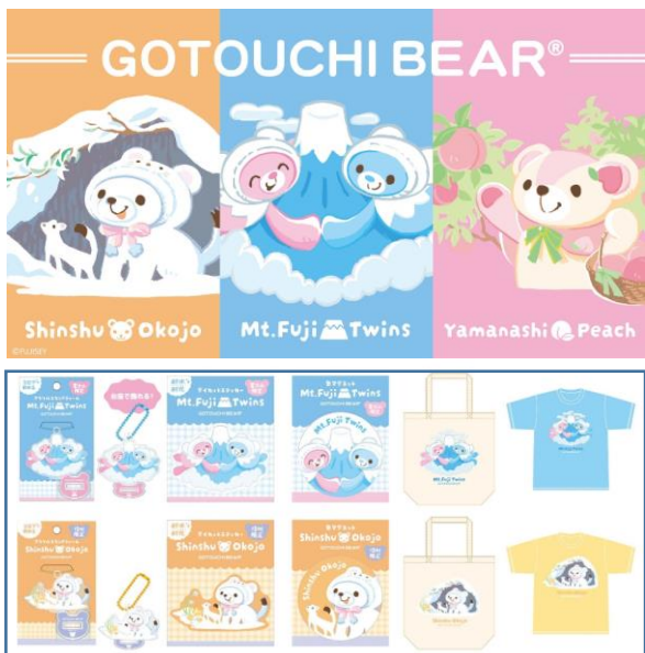
「ご当地ペア富士山」(上)、「ご当地ペア信州おこじょ」(下) モチーフのアイテム

ご当地ペア北海道シマエナガ、お台場、横浜マリノ、名古屋モーニング、京都伏見、福岡あまおうをモチーフにしたステッカー（400円・税別）、アクリルスタンドチャーム（700円・税別）、缶マグネット（500円・税別）、トートバッグ（1,500円・税別）。