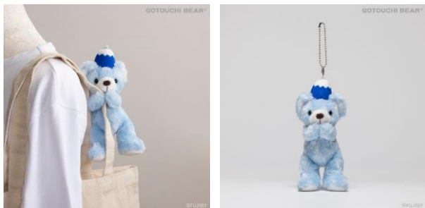
「ご当地ペアハグマスコット」