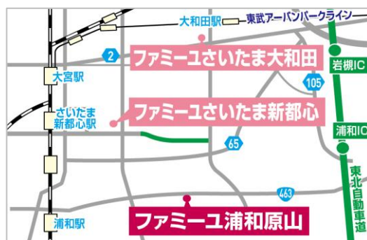
さいたま市内に 3 店舗の展開となる

このたび、埼玉県さいたま市に新ホール「家族葬のファミリー 浦和原山ホール」がオープンします。場所は、地域の方が多く利用する生活道路を兼ねた国道 463 号線（越谷浦和バイパス）沿いの、見晴らしのいいロケーションです。さいたま市には 2024 年 2 月に「さいたま新都心ホール」を出店。2025 年 4 月に「さいたま大和田ホール」と続き、今回で 3 店舗での展開となります。これからも地域の皆さまに、心温まるファミリーの家族葬を提供します。