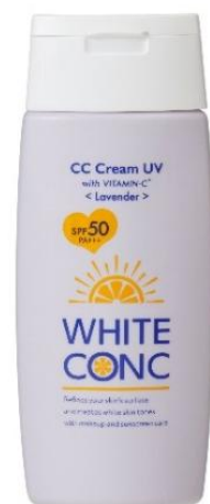
ホワイトコンク ホワイトCC UV II ラベンダー75g ¥1,430(税込)