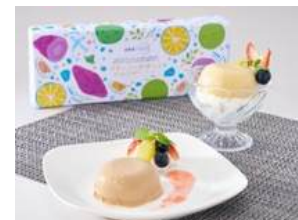
[沖縄] クリーミーデザート