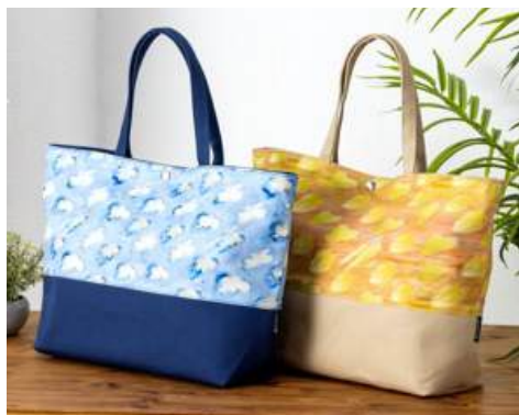
[左から] 青空(ネイビー)、夕焼け(ベージュ)