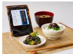
[北海道・九州] 旨のりまめ