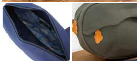
[上] カーキ、ネイビー、マスタードの3色展開