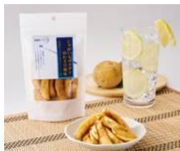
[北海道] じゃがいもザクザク 山わさび風味