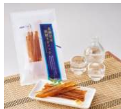
[北海道] 北海道産秋鮭スティック