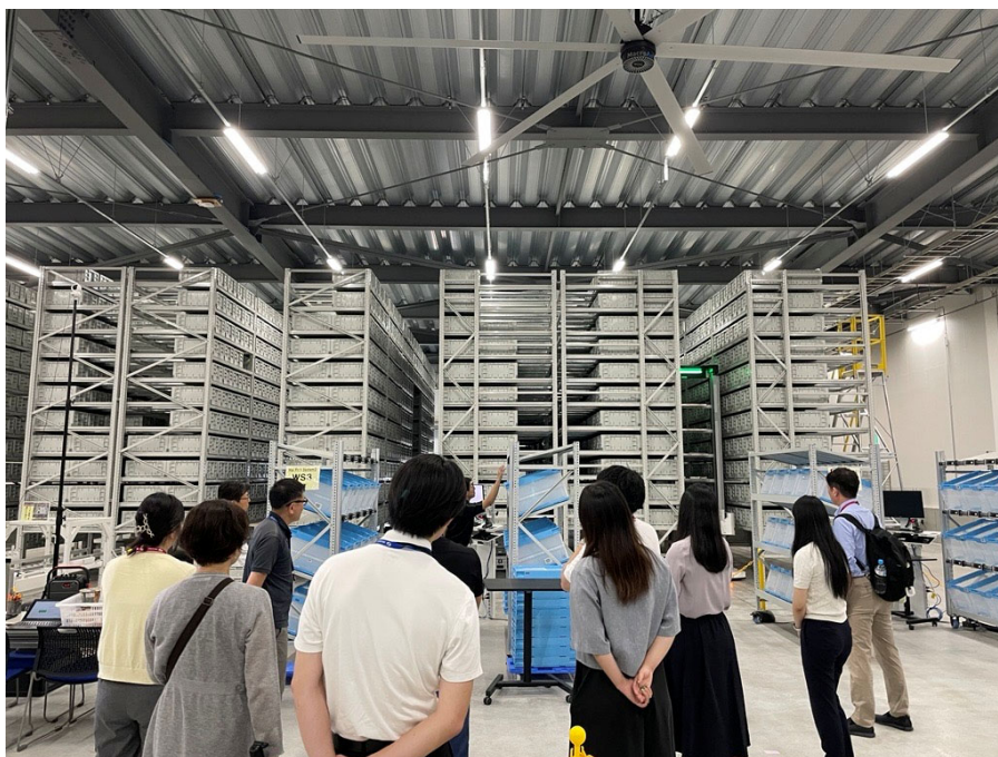
過去ツアーの様子

本ツアーでは、LTのプロフェッショナルである弊社LT企画部社員による解説のもと、業界先端のマテハン機器が実際に稼働する様子をご覧いただけるとともに、AutoStore（オートストア）を導入したオフィス通販向け大規模物流センターの現場もご見学いただけます。