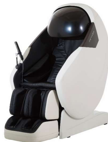
最新機種「あんま王V」

国内で唯一「業務用に特化したマッサージチェア」です。2012年に初代「あんま王」発売以降、大手メーカーが家庭用を主軸とする中、業務用に特化した独自の性能を追求し、業務用として国内トップシェア、累計販売台数は20,000台を突破しました。「不特定多数の使用に耐える耐久性」「パブリックな場所でプライベート空間を実現するフルフェイスフード」「運用・導入の負担軽減」「迅速な補修体制の整備」などの業務用に特化した性能を追求し続けています。多くの施設で選ばれてきた理由として「家庭では味わえない高級感あるデザイン」「家庭用機器には必要とされない、業務用としての機能や高いメンテナンス性」を追求してきたことにあると考えています。先月、業務用としてさらなる進化を遂げたあんま王シリーズの最新機種「あんま王V」を販売開始し、より多くのシーンでの活用を目指します。