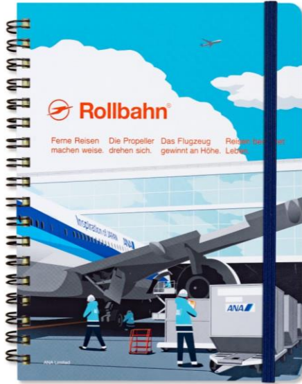
<ANA オリジナル>ロールバーン(出発前)