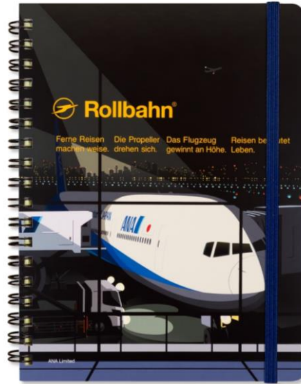
<ANA オリジナル>ロールバーン(到着後)