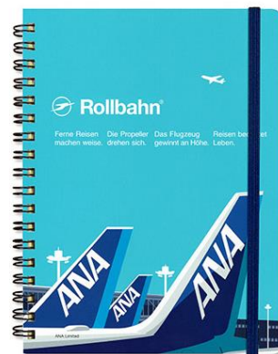
<ANA オリジナル> ロールバーン(駐機場)