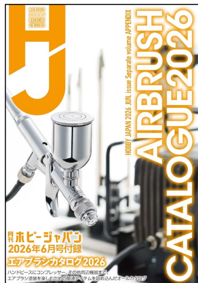
▲特別付録:エアブラシカタログ2026

組むだけで満足できるキットが増えた 2026 年のプラモ市場、それでもなお「塗装」に踏み出したいと感じている人は多いのではないのでしょうか。