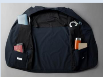
多くの収納にこだわった内装ポケット