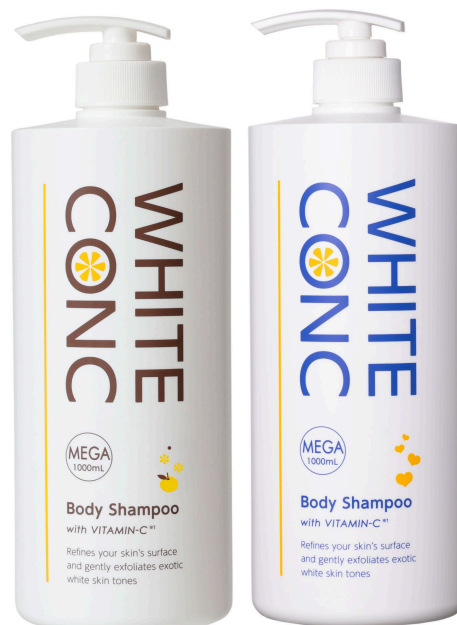
薬用ホワイトコンク ボディシャンプーCⅢ ゆずの香り 1000mL 2,530円（税込）