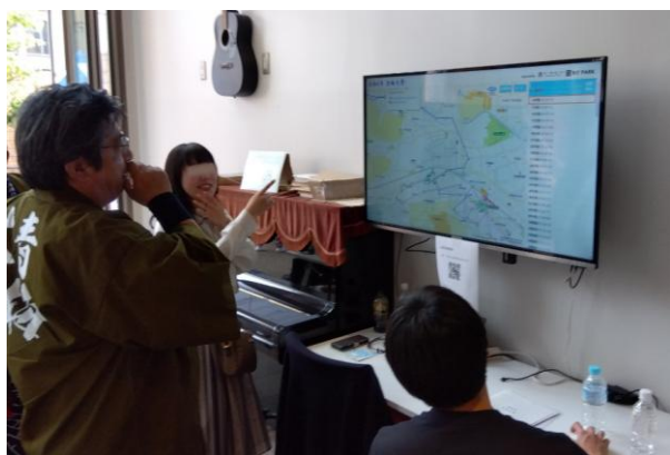
当日の実行委員会事務局の様子