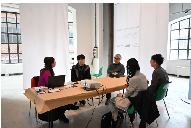
展示会場内で行われたワークショップの様子

デザインウィーク会期中、現地ミラノのデザイン大学 Scuola Politecnica di Design (SPD)、武蔵野美術大学、当社の3者で、「Unfixed Life」の可能性を、多角的な観点から探るワークショップを開催しました。ここで見出されたアイデアを基に、今後も新たな製品開発を進めていきます。