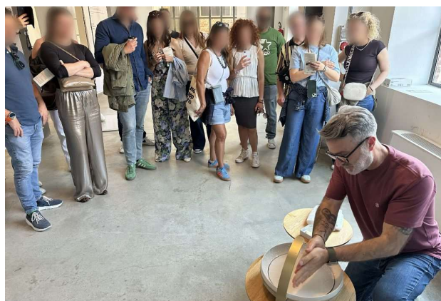
実際にモデルで手を洗う来場者