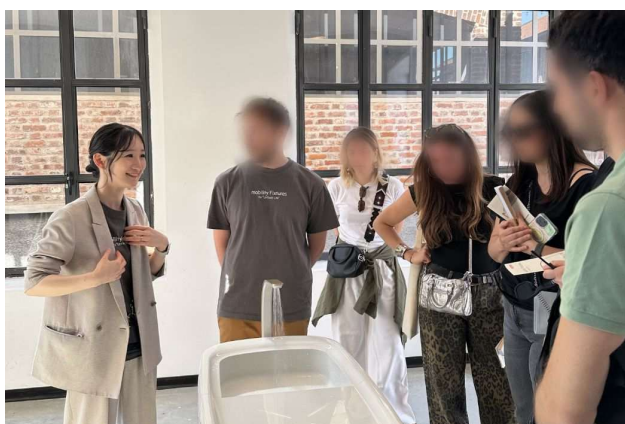
説明に熱心に耳を傾ける来場者

会場では、「住宅設備を動かす」という発想そのものに多くの来場者が足を止めました。「久しぶりにより提案とデザインに巡り合えた」「新しい水まわりの在り方、展開を楽しみにしています」などの声が寄せられました。