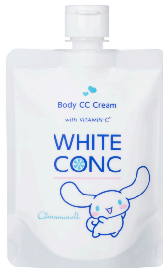
薬用ホワイトコンク ホワイトニングCC CII シナモロールデザイン パッケージ 200g 1,210円(税込)

© 2026 SANRIO CO., LTD. APPROVAL NO. L665577