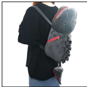
▲プレミアムチケット特典「ゴジラ背負いリュック」

U R L： https://nijigennomori.com/godzilla_awajishima/