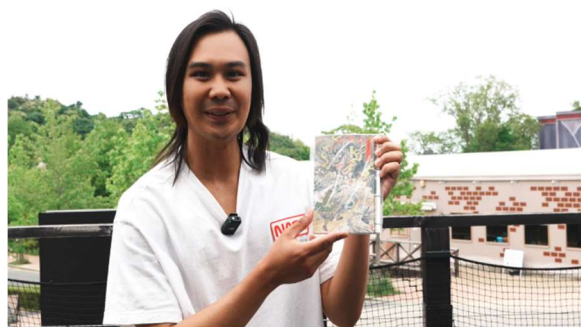
▲和柄ノートをゲットしよう！