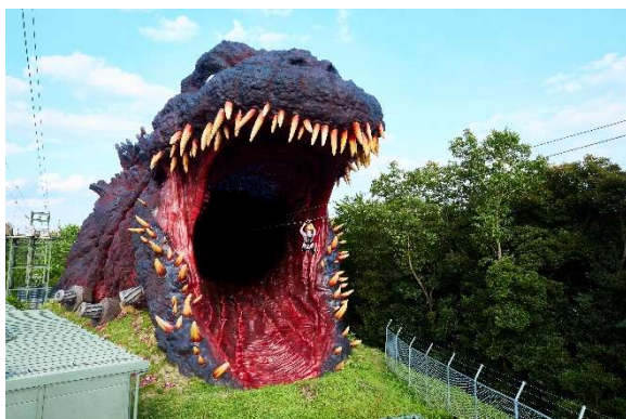
▲最恐ジップラインを飛びまくれ！