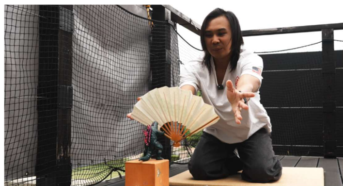
▲投扇興ゲームにチャレンジ！