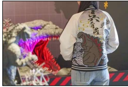
▲VIP ジャーニーパス特典「オリジナル“呉爾羅”スカジャン」