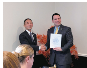
図書館で各種工作用のサービスが提供 アドバイザー認定証を授与されていた