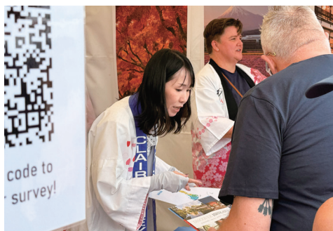
クリアシドニー事務所のブースの様子

本イベントは、パースでの日本への関心の高まりに呼応し、年々来場者が増え、会場の規模も拡大しています。今回、日本からは長野県が初めてブースを出展していましたが、他の自治体におかれましても、今後の出展を検討してみてはいかがでしょうか。