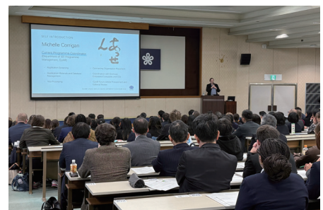
ALT 指導力等向上研修の様子

PC派遣講義は全国12の都道府県にて15回講義を行い、ALT 771人、小学校・中学校・高校の日本人教員 333人が参加しました。資料は英語・日本語の両言語で提供され、主に英語で活発な意見交換が行われました。当協会では2年ごとに講義内容を見直しており、2026年度は新たなテーマの研修を提供する予定です。