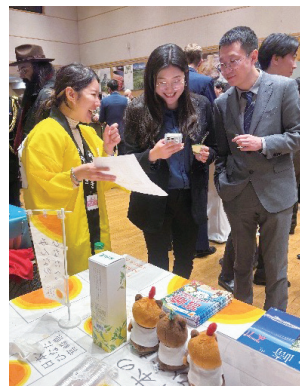
宮崎県ブースで案内を行うクレア職員

今回、宮崎県ブースを訪れた人は「日本に行ったことがあり、次回は地方の観光地を訪問したい」という人も多く、宮崎県のパンフレットを配布し、多くの人に県の魅力を PR しました。