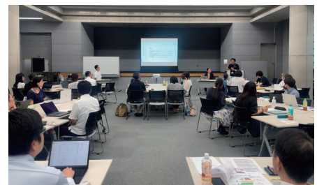
令和7年度の研修の様子

Tel: 03-5213-1725 Mail: tabunka@clair.or.jp