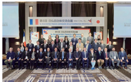
第8回静岡市会議の集合写真

【お問い合わせ】交流親善課 TEL:03-5213-1723 Mail: shimai@clair.or.jp