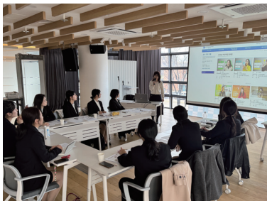
オリエンテーションの様子

クレアソウル事務所では、今後の JET 参加者の一層の活躍を期待するとともに、JET プログラム（語学指導などを行う外国青年招致事業）のさらなる発展に努めてまいります。