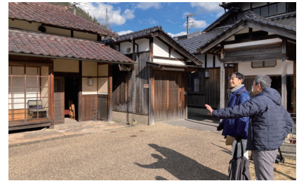
PAによる現地視察の様子（朝来市）

【お問い合わせ】 経済交流課 Tel：03-5213-1726 Mail：keishin@clair.or.jp