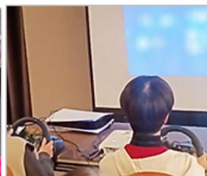
世代を超えて楽しむ eスポーツ体験会