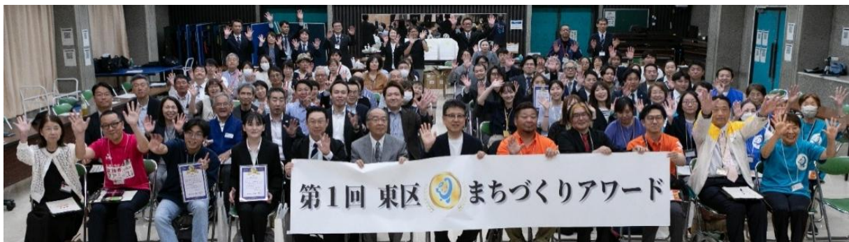
27活動から上位5位に入賞した参画メンバーと大西一史熊本市長（中央）

株式会社きずなホールディングスグループの中核事業会社である株式会社家族葬のファミリーユは、2026年5月25日（月）に熊本県熊本市東区の地域課題解決事業「地域力パワーアップ大作戦 第1回東区まちづくりアワード」において、「グラン・ド・エン賞（最優秀賞）」を受賞しました。