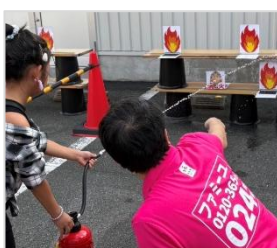
親子で学ぶ防災イベント