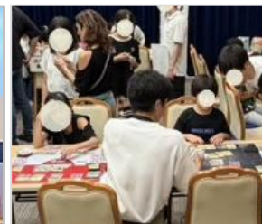
子どもたちに大人気の カードゲームコーナー