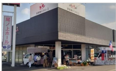
家族葬のファミリー尾ノ上ホール

家族葬のファミリー尾ノ上ホールを会場として2か月ごとに開催し、毎回200人以上が参加します。ホール内ではeスポーツ体験やプラモデル教室、外では多数のキッチンカーや採れたての野菜市コーナーなど、熱気にあふれるにぎやかなイベントです。過去には保護猫譲渡会や防災を学ぶイベントも開催しました。