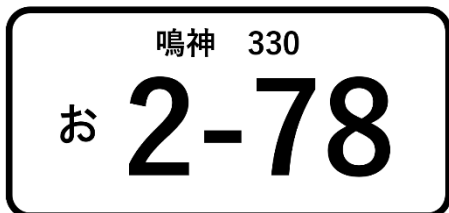
ナンバープレートに78の例