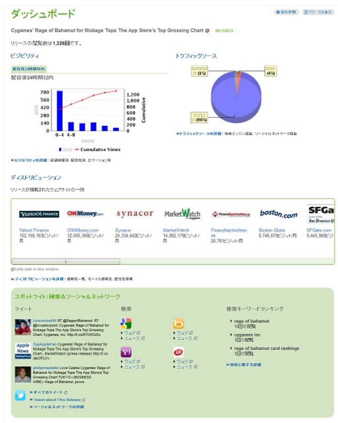
【ダッシュボードレポートイメージ】

プレスリリースの配信後に弊社よりレポートを提出させていただきます。 詳細なアクセスレポートやリリース参照元のトラフィックレポート、 掲載されたオンラインサイトの履歴まで確認することができます。 レポートは配信後1~2週間後に送付させていただきます。