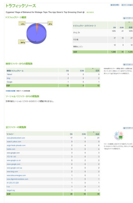
【トラフィックレポートイメージ】