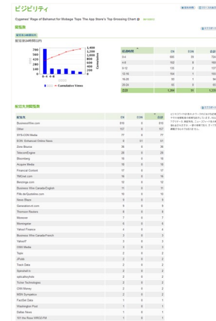
【アクセスレポートイメージ】